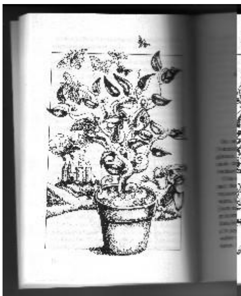
Le pot de haricots danseurs

Si tu veux lire d'autres contes de ce livre rigolo, emprunte-le !