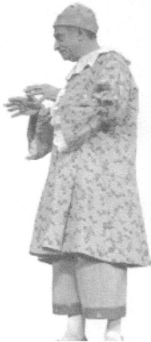
Le Serviteur (Louis)